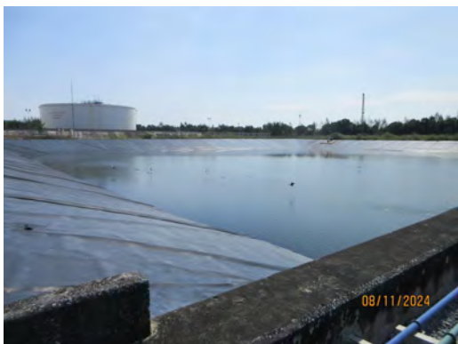
ภาพที่ 2-10 บ่อพักน้ำหล่อเย็น ขนาด 11,000 ลูกบาศก์เมตร