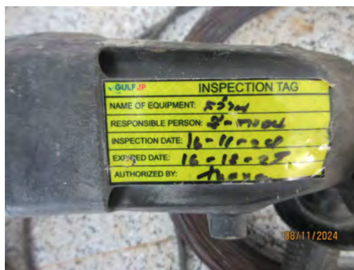
ภาพที่ 2.1-4 ตัวอย่างสติ๊กเกอร์ และการตรวจสอบสภาพเครื่องจักรและอุปกรณ์