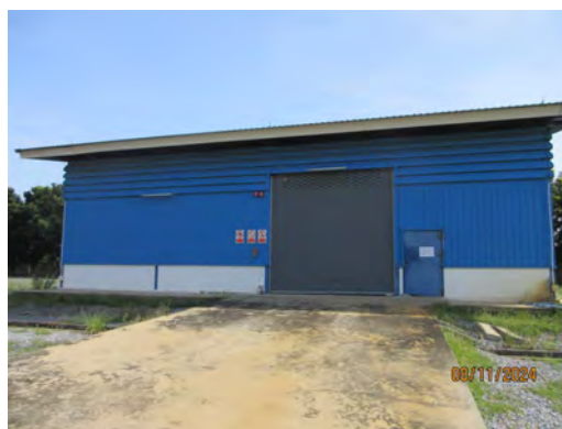
ภาพที่ 2.1-15 พื้นที่เก็บขยะหรือของเสียอันตราย