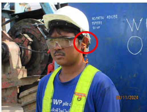
ภาพที่ 2.1-6 คนงานสวมใส่อุปกรณ์ป้องกันเสียง