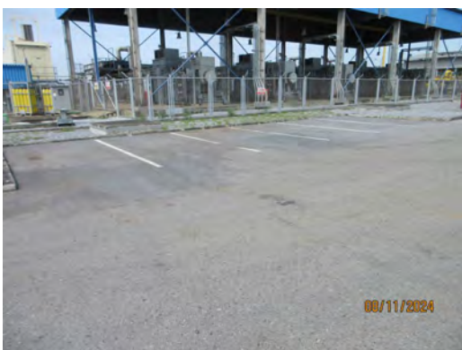
ภาพที่ 2.1-16 พื้นที่จอดยานพาหนะ