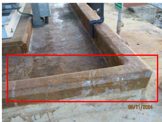
ภาพที่ 2-32 พื้นที่เก็บสารเคมีที่มีคันคอนกรีตล้อมรอบ ถึงเก็บสารเคมี