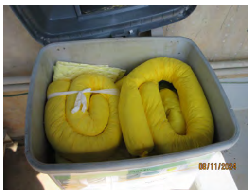
ภาพที่ 2-41 วัสดุดูดซับ (Absorbent)