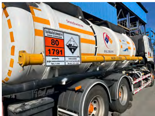
ภาพที่ 2-20 ป้ายเตือนติดข้างรถขนส่งสารเคมี