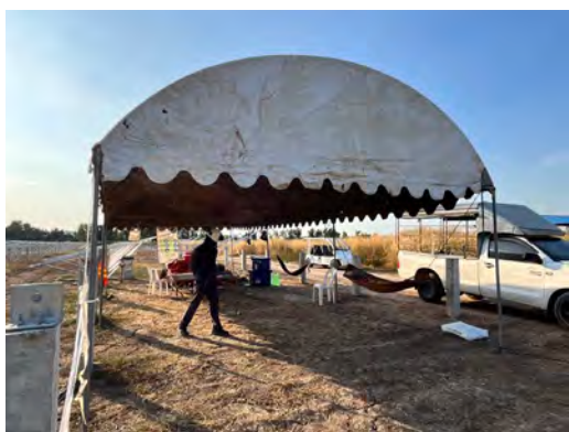
ภาพที่ 2.1-8 ที่พักคนงาน