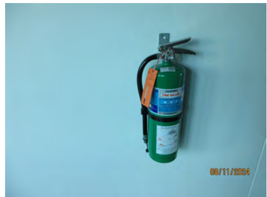
ภาพที่ 2-36 อุปกรณ์ดับเพลิงภายในอาคาร