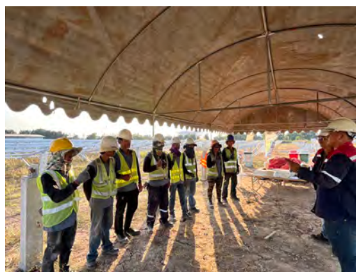
ภาพที่ 2.1-18 การอบรมและให้ความรู้แก่คนงาน ก่อนเริ่มงาน (Safety Talk)