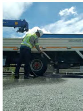
ภาพที่ 2.1-2 พื้นที่ล้างล้อรถ