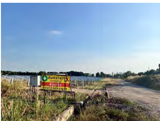
ภาพที่ 2.1-17 ป้ายเตือนก่อนถึงพื้นที่ก่อสร้าง