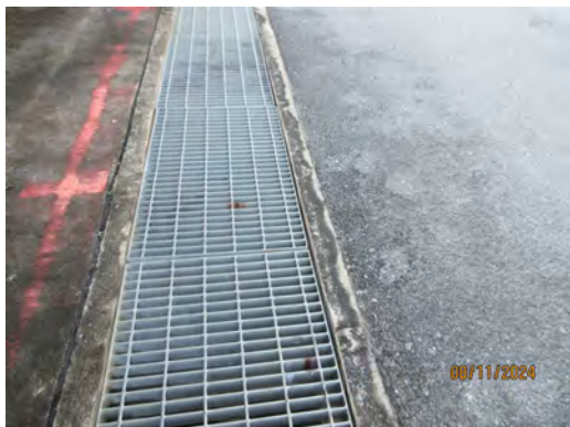
ภาพที่ 2-23 รางระบายน้ำฝน