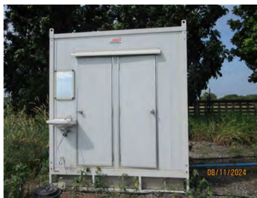
ภาพที่ 2.1-9 ห้องน้ำ-ห้องส้วม สำหรับคนงาน