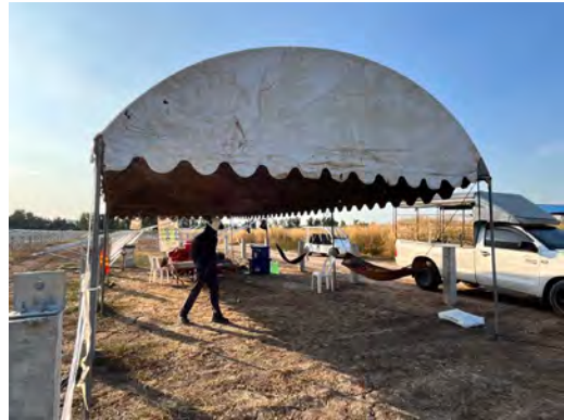
ภาพที่ 2.1-22 พื้นที่พักผ่อนในช่วงพักกลางวัน