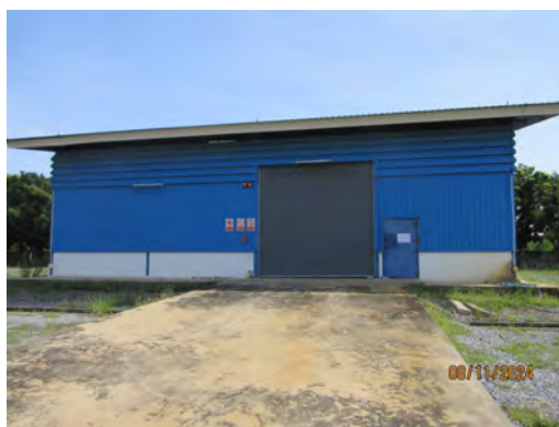
ภาพที่ 2-22 โรงพักของเสีย