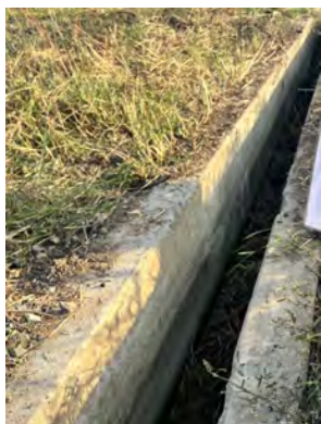
ภาพที่ 2.1-10 รางระบายน้ำ