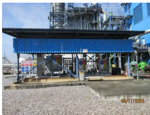
ภาพที่ 2-33 บริเวณพื้นที่การจัดวางสารเคมีที่มีการ ไหลเวียนถ่ายเทของอากาศที่ดี