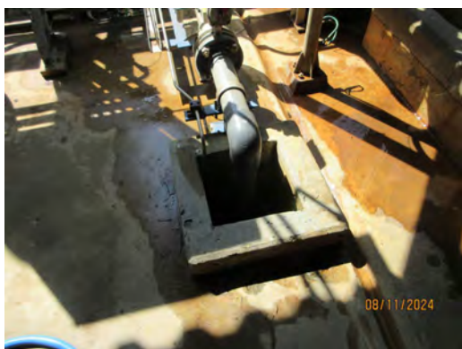
ภาพที่ 2-14 ถังปรับสภาพความเป็นกรด-ด่าง (Neutralization Tank)