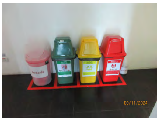
ภาพที่ 2-21 ถังขยะบริเวณโครงการ