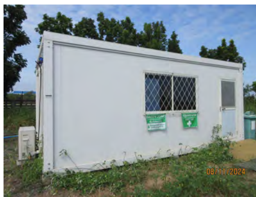
ภาพที่ 2.1-7 สำนักงานชั่วคราว