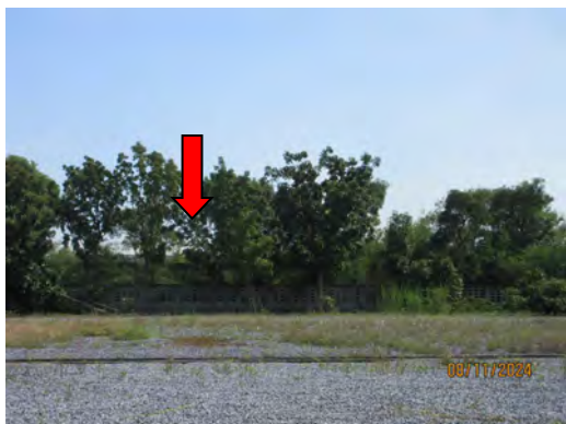
ภาพที่ 2.1-5 กำแพงหรือรั้ว บริเวณริมรั้วใกล้เคียงกับชุมชน