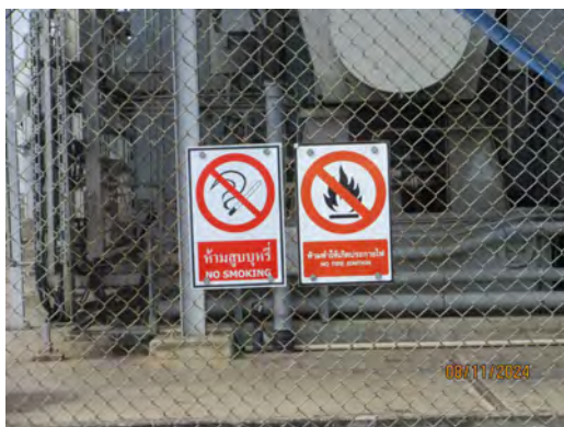
ภาพที่ 2-42 ป้ายเตือนบริเวณสถานีควบคุมความดัน และวัดปริมาตรก๊าซธรรมชาติ