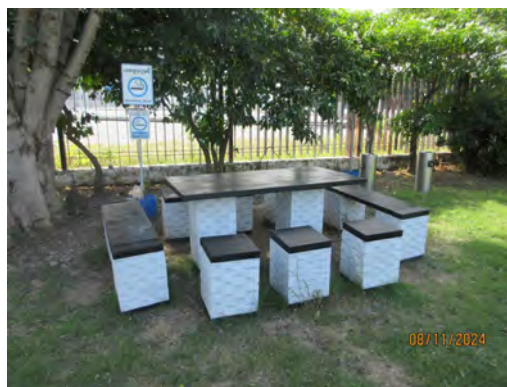
ภาพที่ 2-37 ป้ายเตือนห้ามสูบบุหรี่ และพื้นที่สำหรับสูบบุหรี่