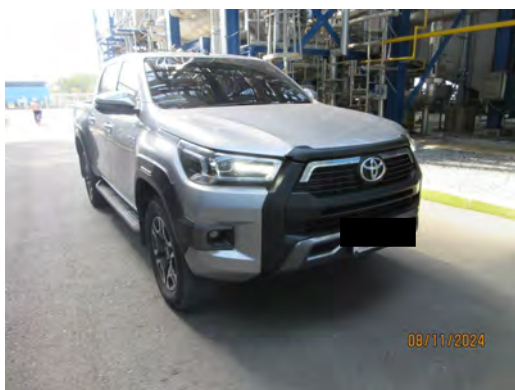
ภาพที่ 2-26 ยานพาหนะเพื่อใช้ในกรณีฉุกเฉิน