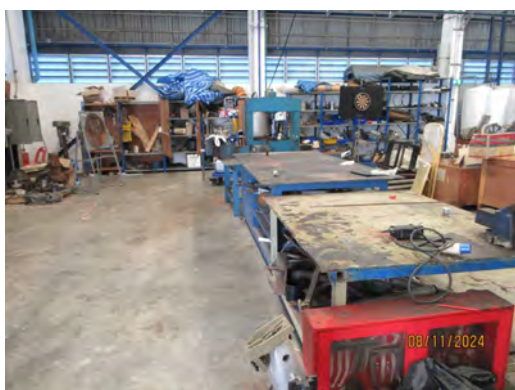
ภาพที่ 2.1-12 พื้นที่สำหรับซ่อมบำรุงเครื่องยนต์ และเครื่องจักร