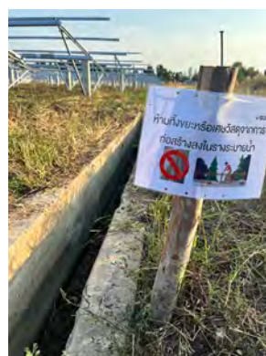
ภาพที่ 2.1-13 ป้ายห้ามทิ้งขยะหรือเศษวัสดุจากการ ก่อสร้างลงในท่อระบายน้ำ