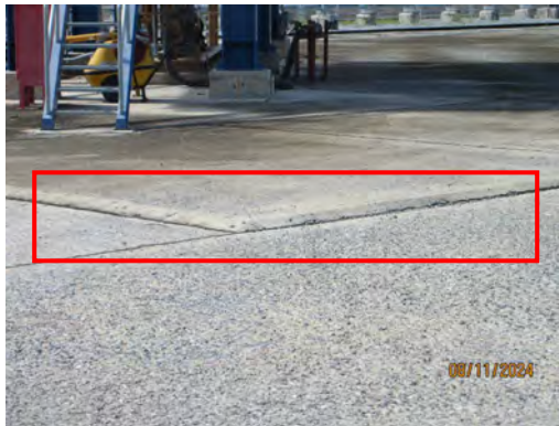
ภาพที่ 2-44 คั่นล้อยบริเวณสถานีสูบน้ำ