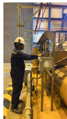
ภาพที่ 2-6 พนักงานสวมใส่อุปกรณ์ป้องกันเสียง