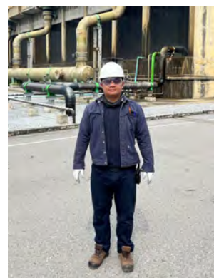
ภาพที่ 2-27 พนักงานสวมใส่อุปกรณ์ป้องกันอันตราย ส่วนบุคคล