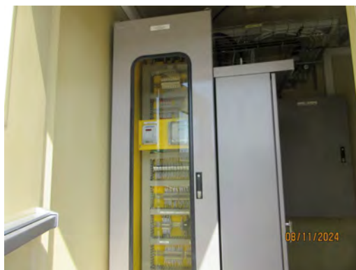
ภาพที่ 2.2-2 ระบบตรวจวัดคุณภาพอากาศจากปล่องระบายอากาศอย่างต่อเนื่อง (CEMs)