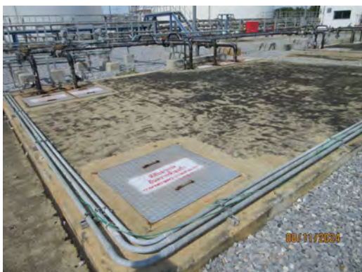
ภาพที่ 2-12 บ่อตรวจสอบคุณภาพน้ำทิ้ง