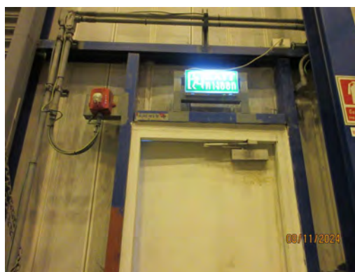
ภาพที่ 2-39 ป้ายบอกทางหนีไฟ