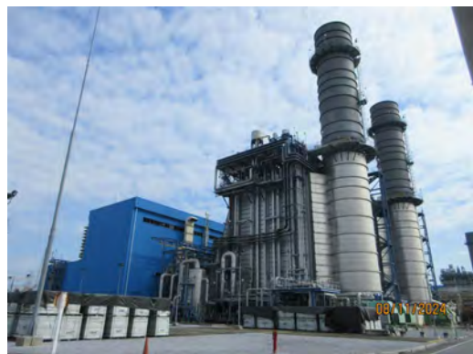
ภาพที่ 2-4 ปล่องระบายอากาศ