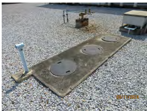
ภาพที่ 2-15 ถังบำบัดน้ำเสียจากการอุปโภค-บริโภค