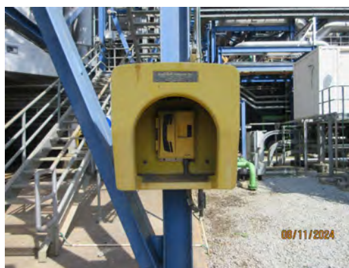
ภาพที่ 2-38 โทรศัพท์ฉุกเฉินตามพื้นที่ต่างๆ ภายในโรงไฟฟ้า