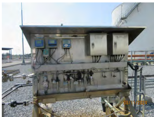
ภาพที่ 2-19 เครื่องตรวจวัดคุณภาพน้ำแบบอัตโนมัติ บริเวณบ่อพักน้ำทิ้ง