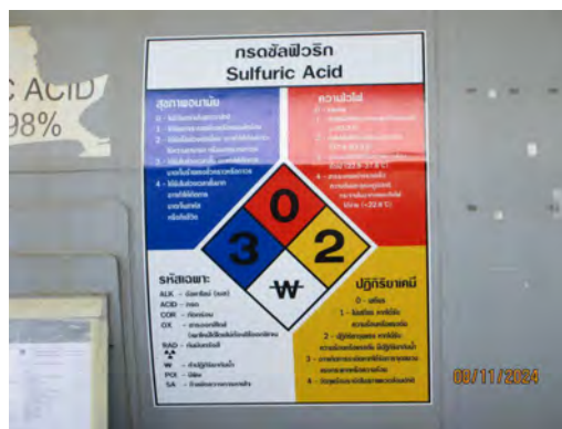
ภาพที่ 2-31 ข้อมูลความปลอดภัยของเคมีภัณฑ์