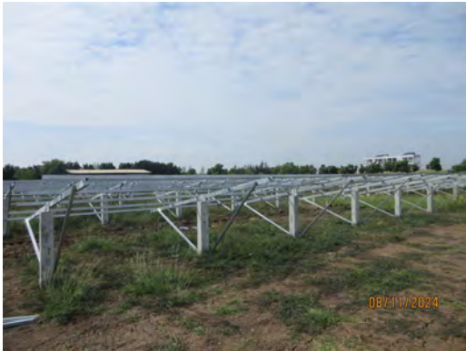
ภาพที่ 2.1-21 พื้นที่ก่อสร้าง