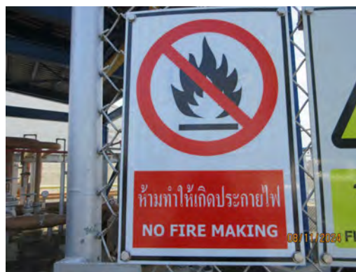
ภาพที่ 2-35 ป้ายเตือนห้ามทำให้เกิดประกายไฟ