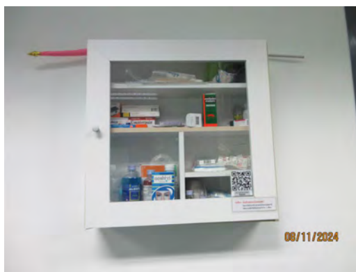
ภาพที่ 2-25 อุปกรณ์ปฐมพยาบาลเบื้องต้น