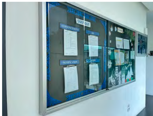
ภาพที่ 2-24 การติดเอกสารที่บอร์ดประชาสัมพันธ์