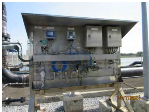
ภาพที่ 2-11 เครื่องตรวจวัดคุณภาพน้ำหล่อเย็นแบบ อัตโนมัติบริเวณบ่อพักน้ำหล่อเย็น