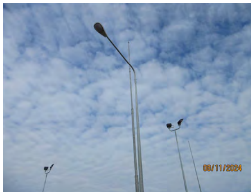
ภาพที่ 2-29 หลอดไฟให้แสงสว่างบริเวณพื้นที่โรงไฟฟ้า