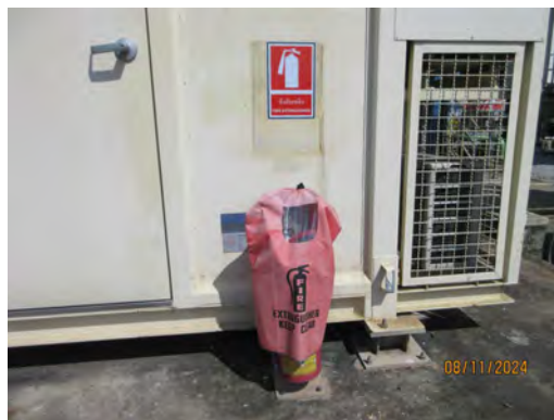
ภาพที่ 2-30 อุปกรณ์ดับเพลิงในพื้นที่โรงไฟฟ้า