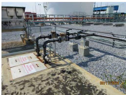
ภาพที่ 2-13 วาล์วควบคุมการเปิด-ปิด บริเวณบ่อตรวจสอบคุณภาพน้ำทิ้ง