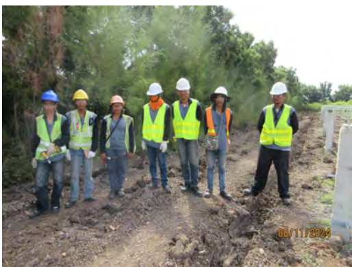
ภาพที่ 2.1-19 คนงานสวมใส่อุปกรณ์คุ้มครองความปลอดภัยส่วนบุคคล (PPE)