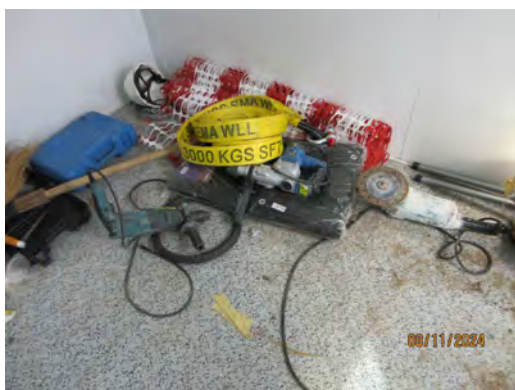
ภาพที่ 2.1-3 พื้นที่สำหรับจัดเก็บอุปกรณ์ในการก่อสร้าง