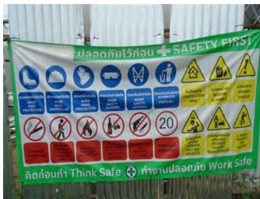
ภาพที่ 2.1-20 ป้ายเตือนเขตพื้นที่ก่อสร้าง