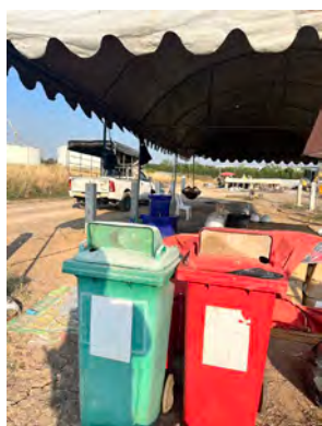
ภาพที่ 2.1-14 ถังขยะมีฝาปิดมิดชิด