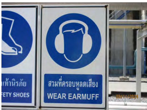
ภาพที่ 2.2-5 สัญลักษณ์หรือป้ายเตือนในบริเวณที่ ระดับเสียงเกิน 85 เดซิเบล(เอ)