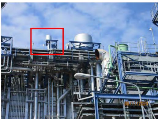
ภาพที่ 2-8 การติดตั้ง Silencer