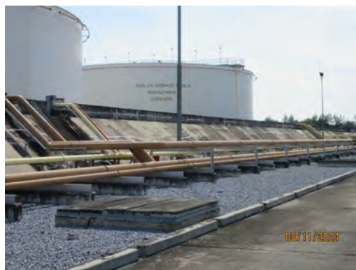
ภาพที่ 2-40 คันล้อมรอบบริเวณถังเก็บน้ำมัน