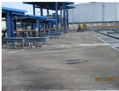
ภาพที่ 2-43 พื้นคอนกรีตบริเวณสถานีสูบน้ำ