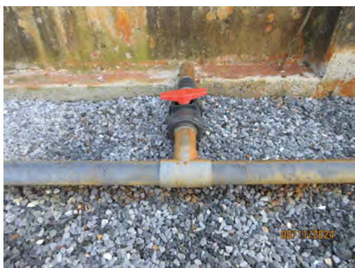
ภาพที่ 2-34 วาล์วและข้อต่อบริเวณคันคอนกรีต