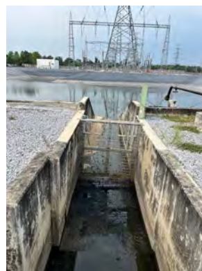
ภาพที่ 2.1-11 บ่อดักตะกอน