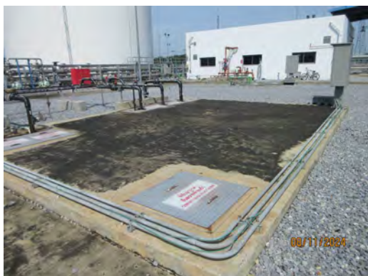
ภาพที่ 2-18 บ่อรวบรวมน้ำทิ้ง