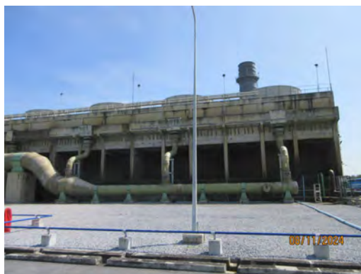
ภาพที่ 2.2-1 ระบบหล่อเย็น