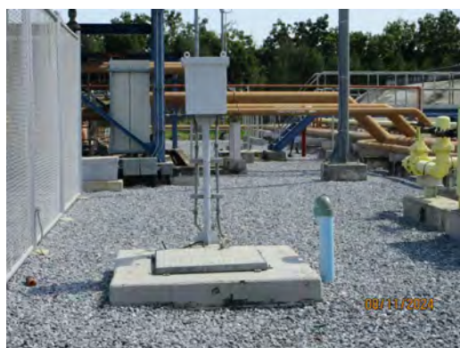
ภาพที่ 2-17 บ่อแยกน้ำมัน (Oil Separator)