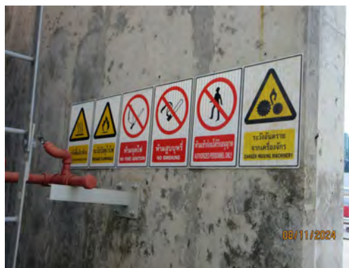
ภาพที่ 2-28 ป้ายเตือนบริเวณที่อาจเกิดอันตราย