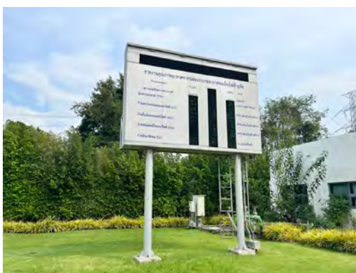
ภาพที่ 2.2-3 จอแสดงผลการตรวจวัดคุณภาพอากาศจากปล่องระบายบริเวณหน้าโครงการ