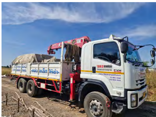
ภาพที่ 2.1-1 การปิดคลุมรถบรรทุก