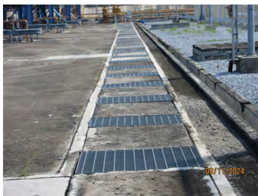
ภาพที่ 2-16 รางรวบรวมน้ำที่อาจปนเปื้อนน้ำมัน