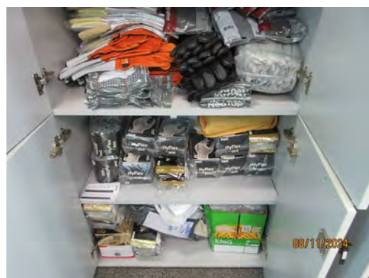
ภาพที่ 2-7 อุปกรณ์ป้องกันอันตรายส่วนบุคคล (PPE) สำรอง